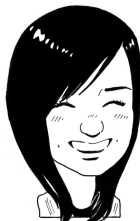
チーフデザイナー (産休中)