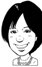
ワクワク 姓名判断